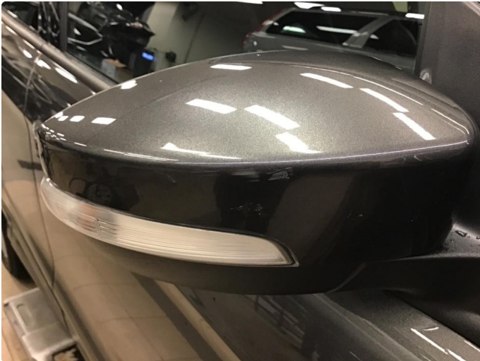
1.1 Speilhus riper