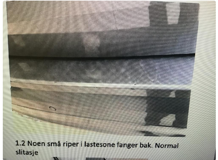
1.2 Noen små riper i lastesone støtfanger bak.