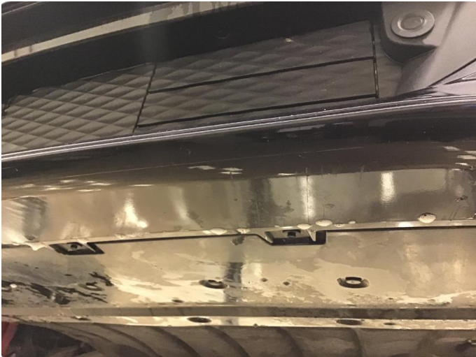
1.1 Noen riper+ liten skade på underside støtfanger foran.