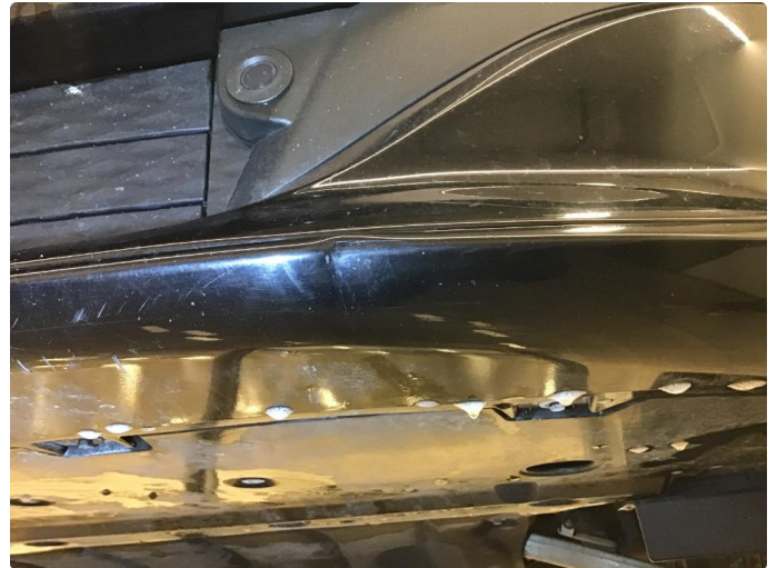
1.1 Noen riper+ liten skade på underside støtfanger foran.