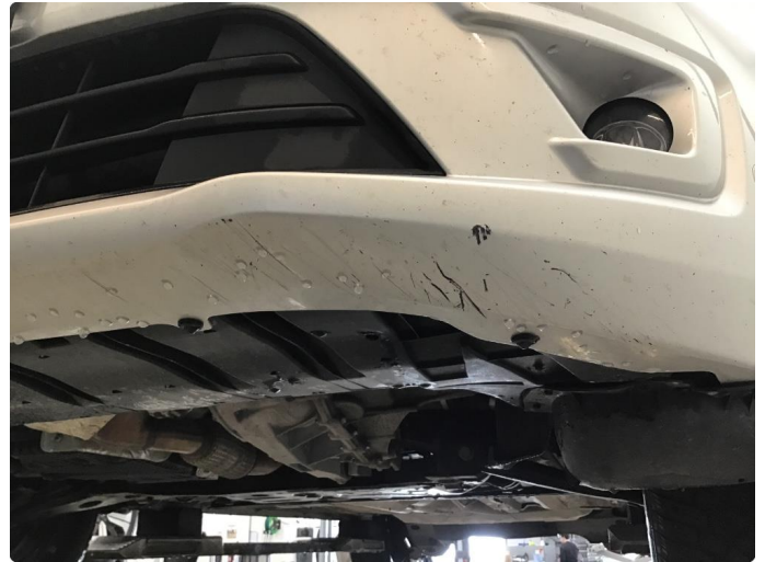
1.1 Skrubbskader underkant støtfanger foran.