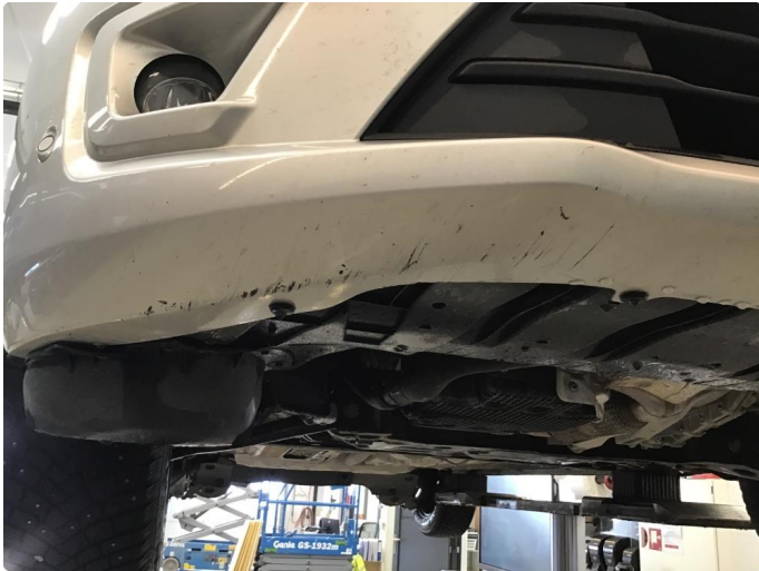
1.1 Skrubbskader underkant støtfanger foran.