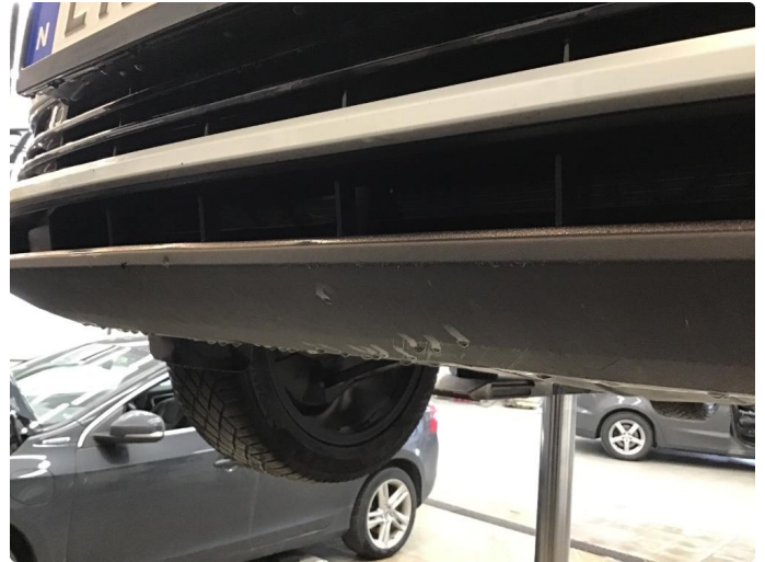
1.1 Noen skrubbeskader under støtfanger foran.