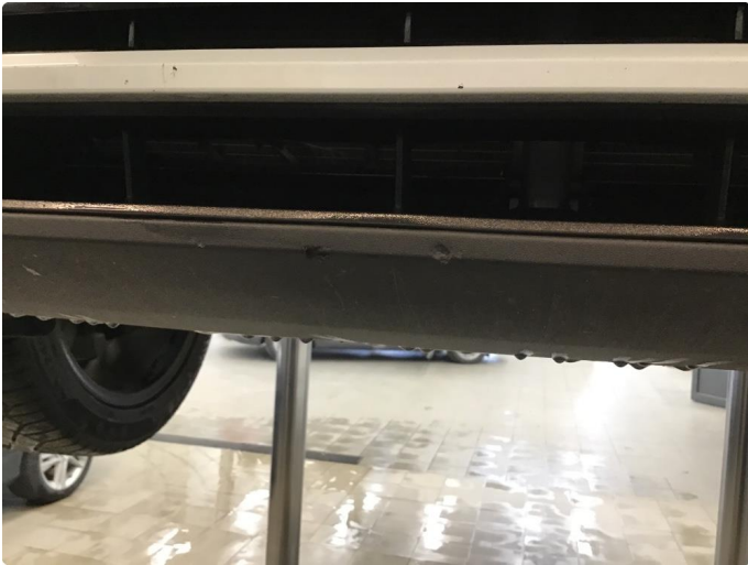
1.1 Noen skrubbeskader under støtfanger foran.