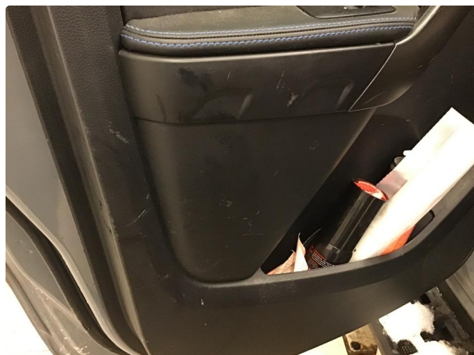
3.2 Noen riper dørtrekk venstre bakdør.