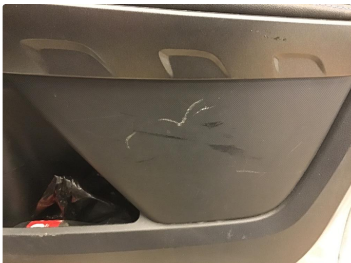
3.1 Noen riper dørtrekk høyre framdør.