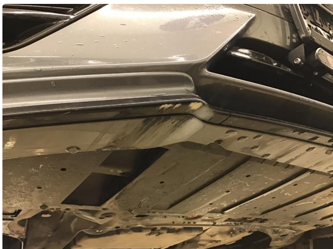
1.1 Noen skrubbskader under støtfanger foran.