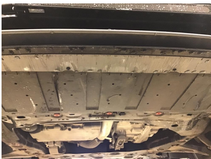
1.1 Noen skrubbskader under støtfanger foran.