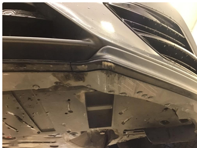
1.1 Noen skrubbskader under støtfanger foran.