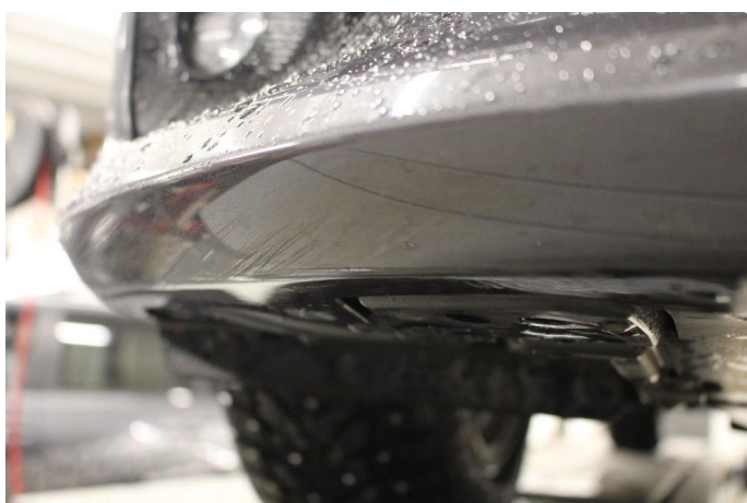
1.5 Skrubbskader underkant