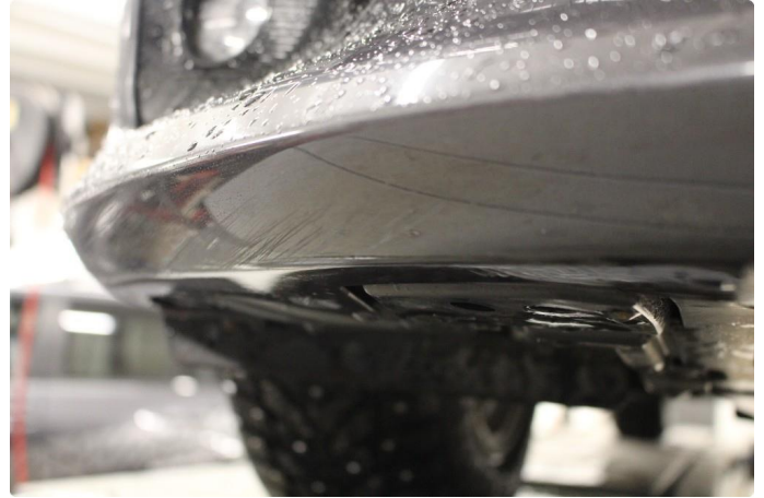
1.3 Skrubb-skader underkant