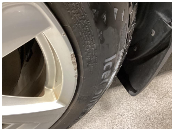
1.2 1 stk kantkjørt vinterfelg