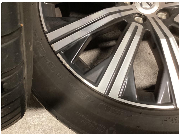
1.1 1 stk kantkjørt sommerfelg