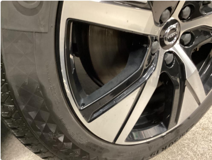
1.1 1 stk kantkjørt vinterfelg