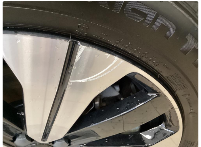
1.1 1 stk kantkjørt vinterfelg