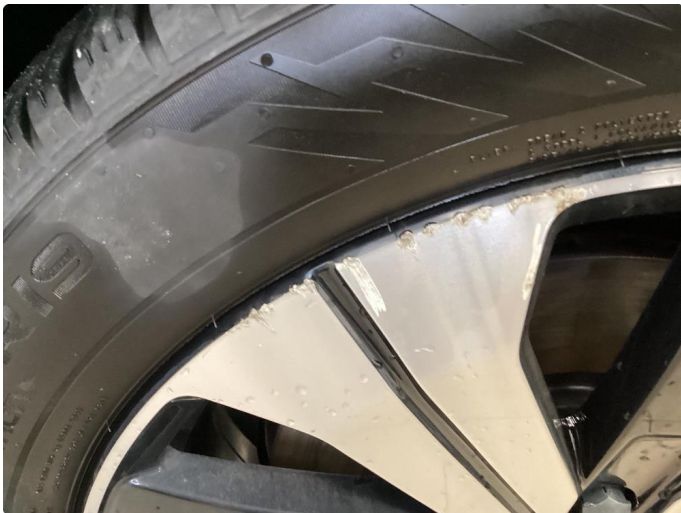
1.1 1 stk kantkjørt vinterfelg