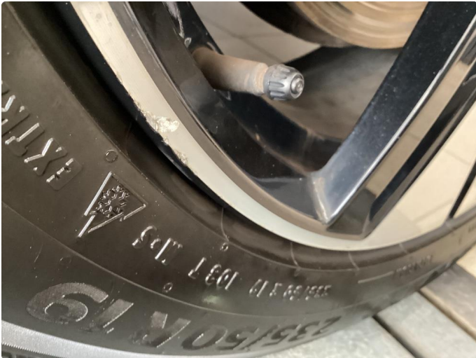
1.1 1 stk kantkjørt vinterfelg