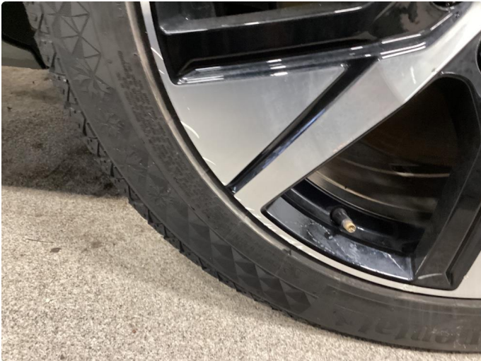
1.1 Skade på felg