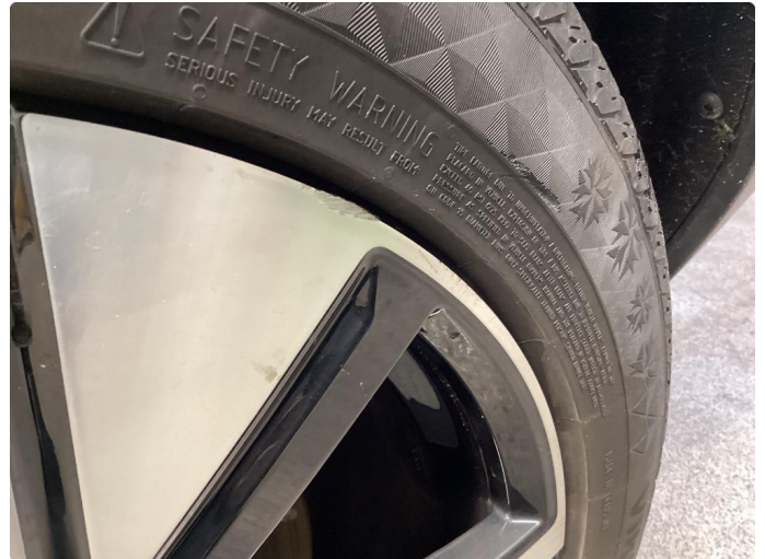
1.1 Skade på felg