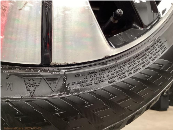
1.1 1 stk kantkjørt felg