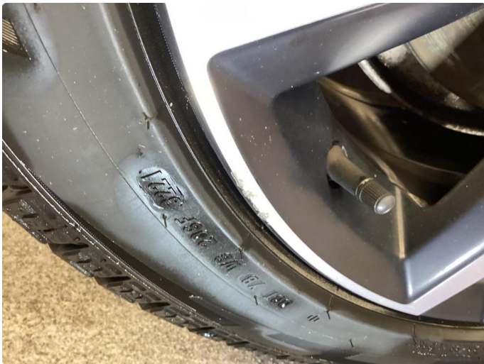
1.1 Kantkjørt vinterfelg