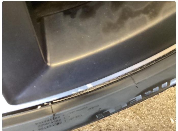
1.1 Kantkjørt vinterfelg