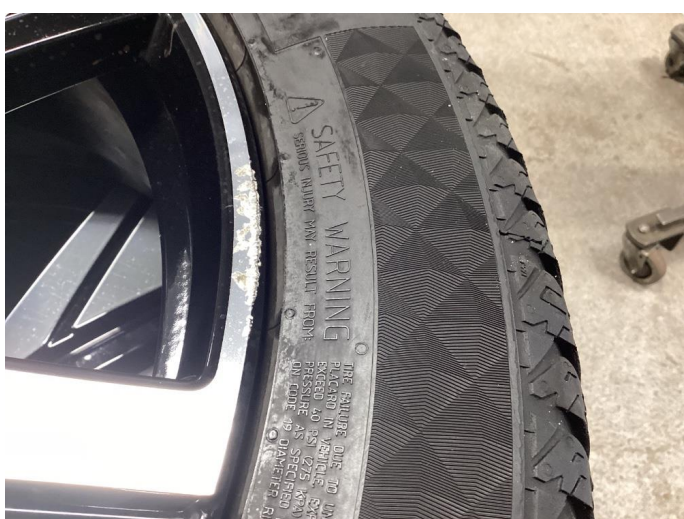
1.2 1 stk kantkjørt vinterfelg