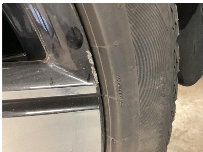
1.1 3 stk kantkjørte sommerfelger