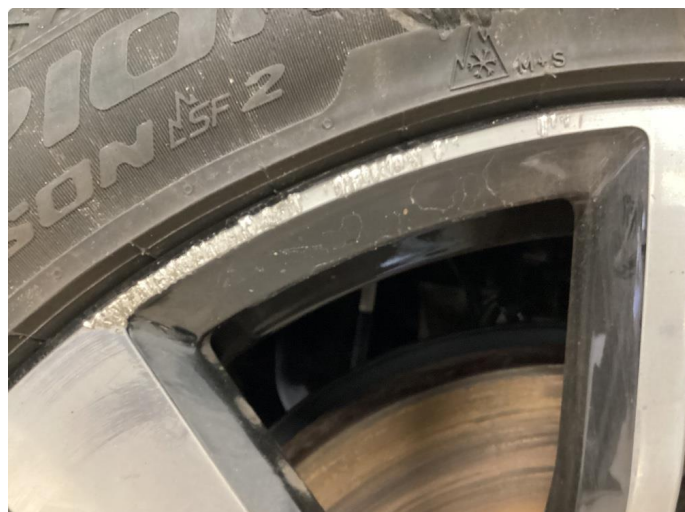
1.1 3 stk kantkjørte sommerfelger