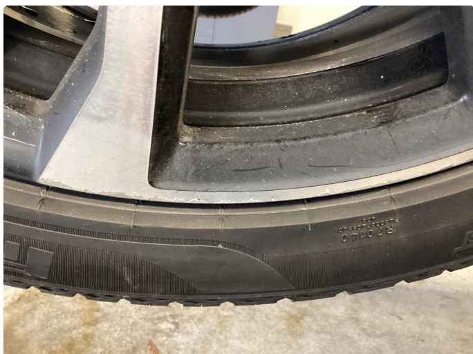
1.1 3 stk kantkjørte sommerfelger