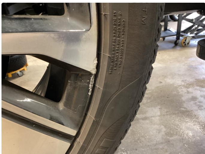
1.1 3 stk kantkjørte sommerfelger