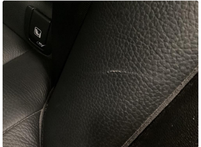
2.1 Skade på setetrekk