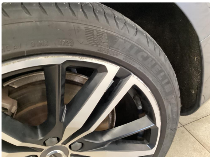
1.1 2 stk kantkjørte sommerfelger