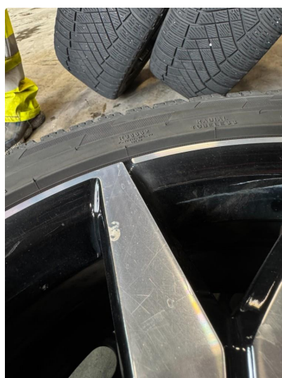
1.2 1 stk kantkjørt vinterfelg