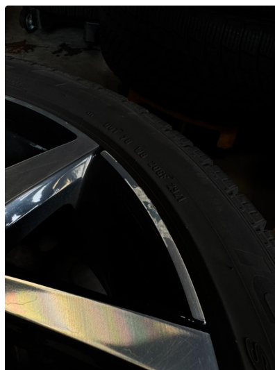
1.2 1 stk kantkjørt vinterfelg