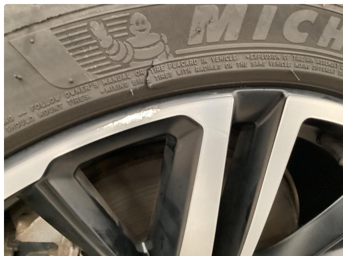
1.1 2 stk kantkjørte sommerfelger