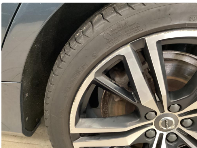
1.1 2 stk kantkjørte sommerfelger