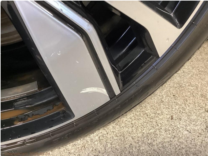
1.1 1 stk kantkjørt sommerfelg