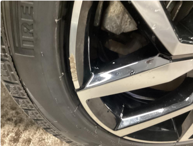
1.1 1 stk kantkjørt vinterfelg