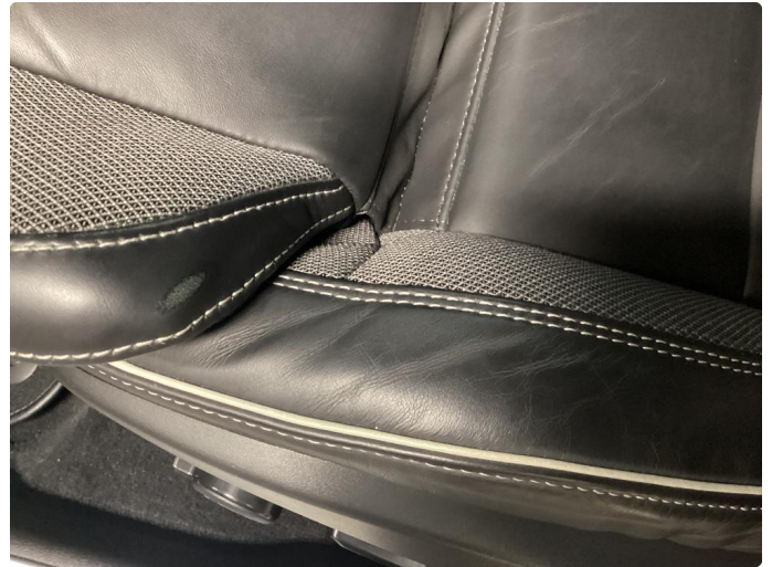
2.1 Skade på setetrekk