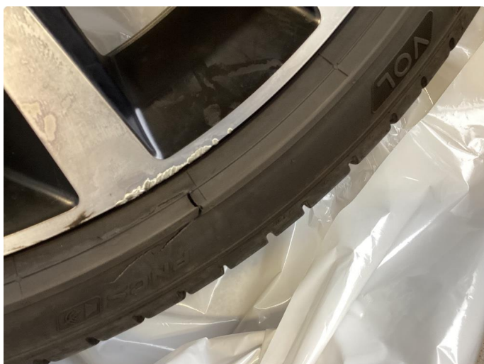
1.1 3 stk kantkjørte felger