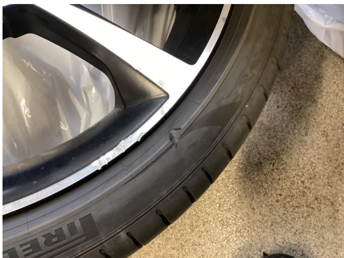
1.1 3 stk kantkjørte felger