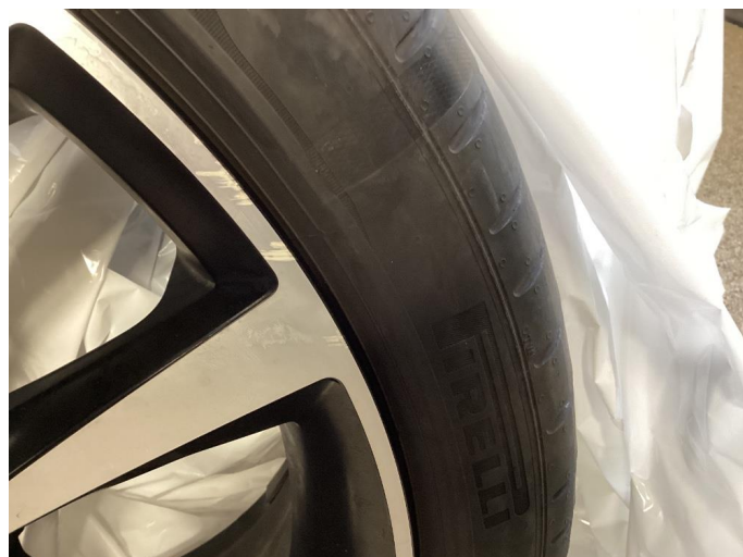
1.1 3 stk kantkjørte felger