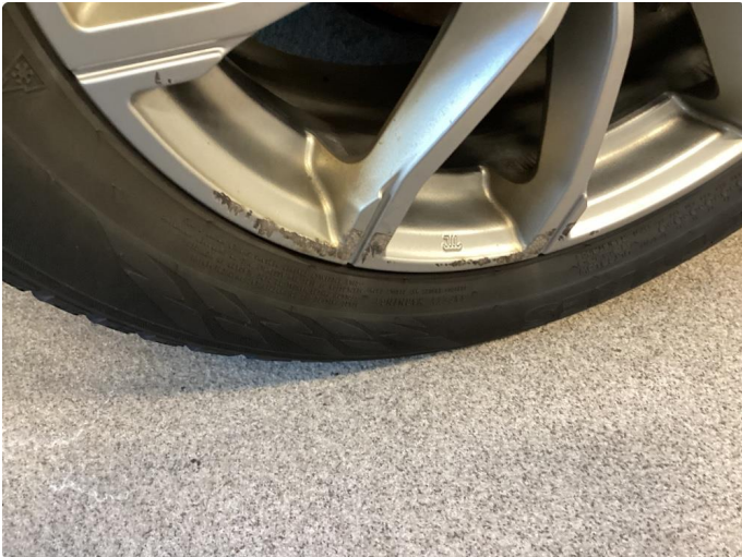
1.1 1 stk kantkjørt vinterfelg