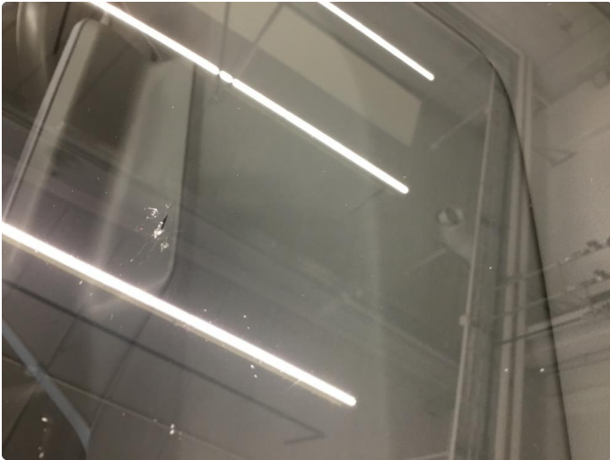
1.1 Steinsprut med sprekk