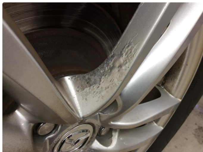
1.1 Betydelig oksidering