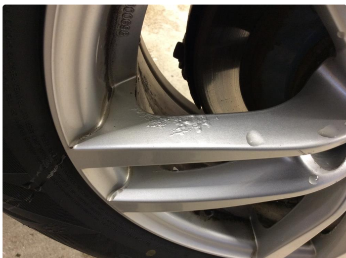
1.1 Betydelig oksidering