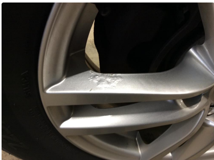
1.1 Betydelig oksidering