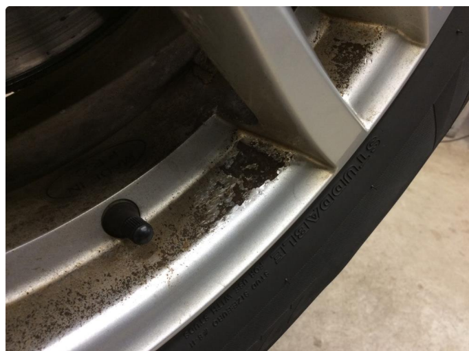
1.1 Betydelig oksidering