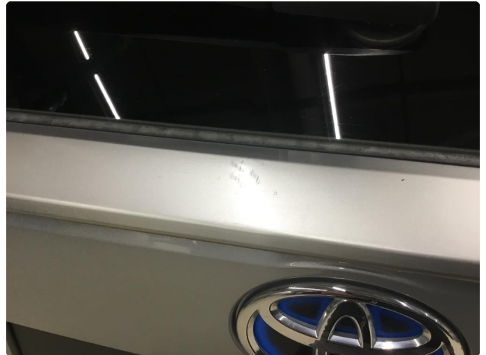
1.1 Noen riper