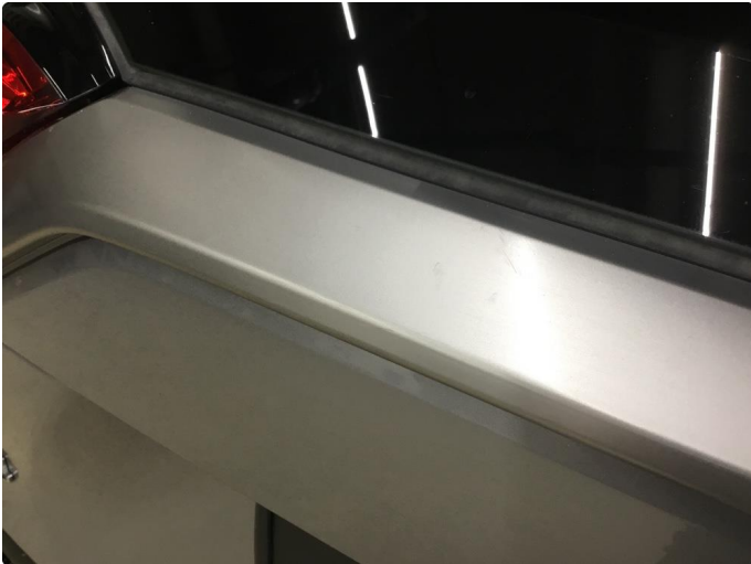
1.1 Noen riper