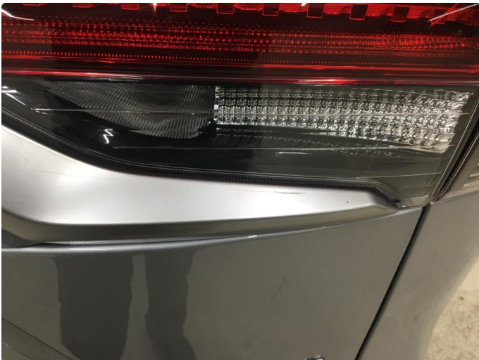
1.1 Noen riper