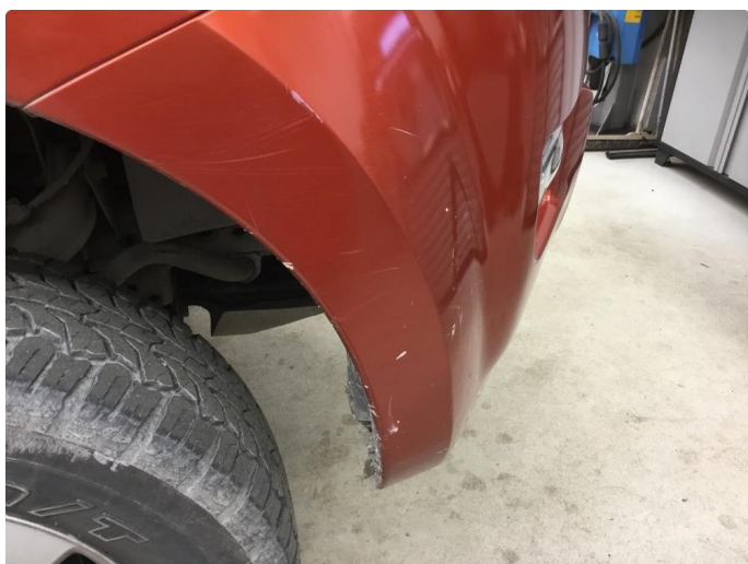
1.7 Ripe(r) ned til grunning