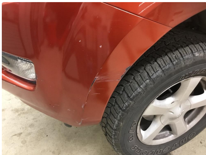
1.7 Ripe(r) ned til grunning