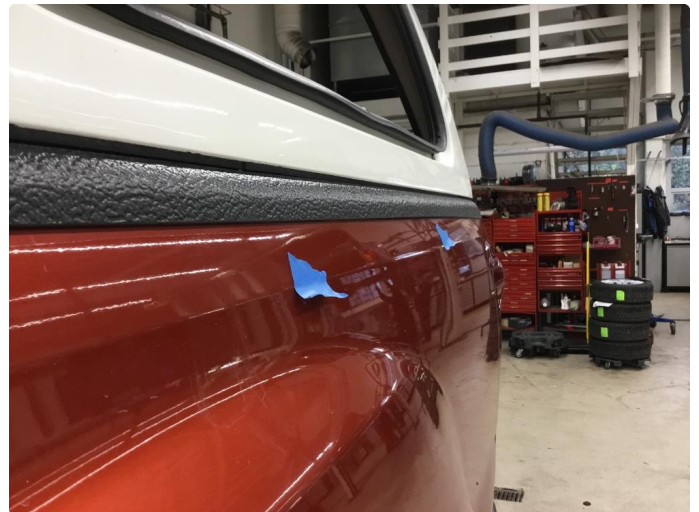
1.4 Flere bulker