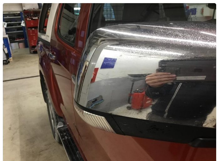
1.5 Speilhus skadet