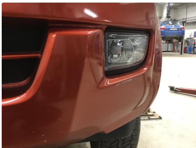
1.7 Ripe(r) ned til grunning