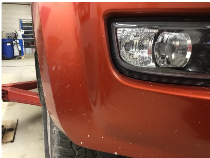
1.7 Ripe(r) ned til grunning