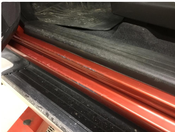
1.6 Slitt innsteg