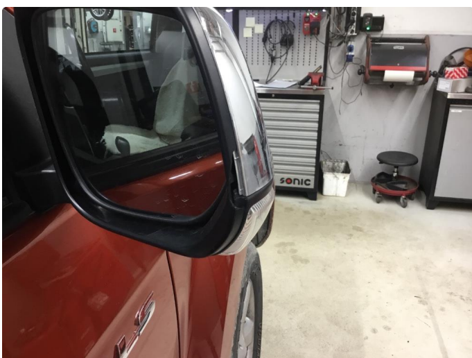
1.5 Speilhus skadet