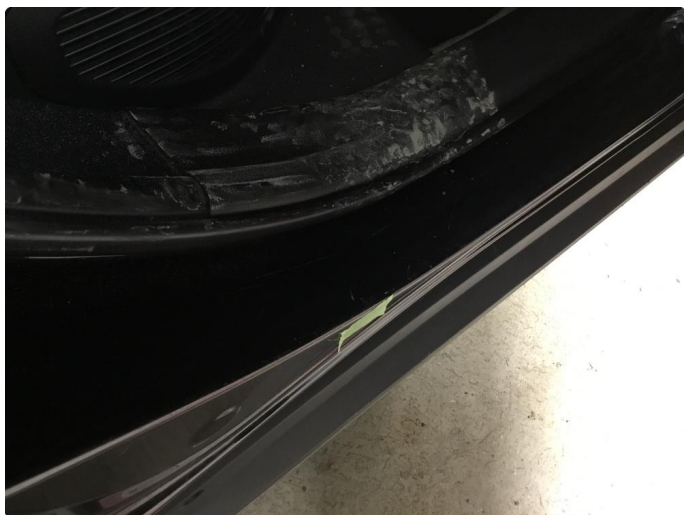
1.5 Bulk(er) med lakkskade