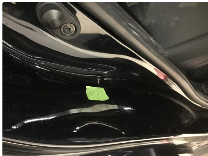
1.5 Bulk(er) med lakkskade