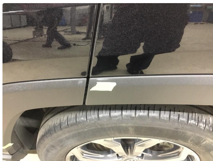
1.4 List mangler/skadet