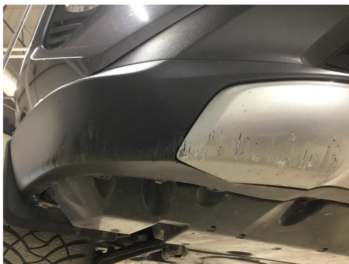
1.4 Flere bulker