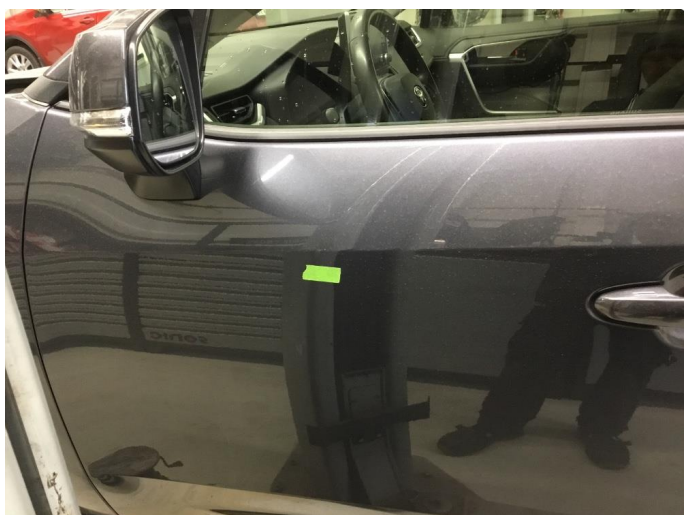
1.2 Bulk med lakkskade