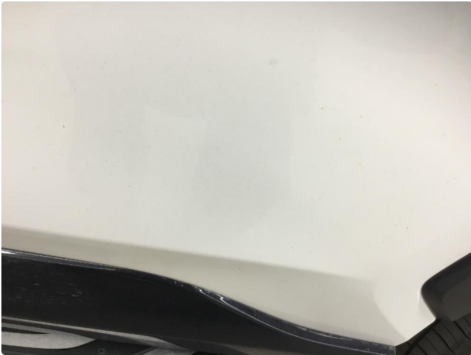
1.1 Steinsprut med rust