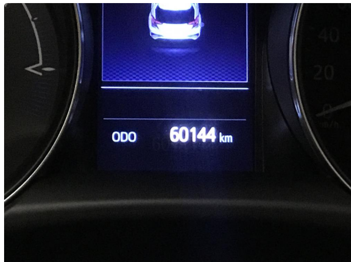
2.1 Trenger service