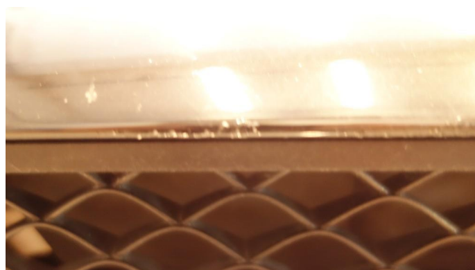
1.1 Rust i fals