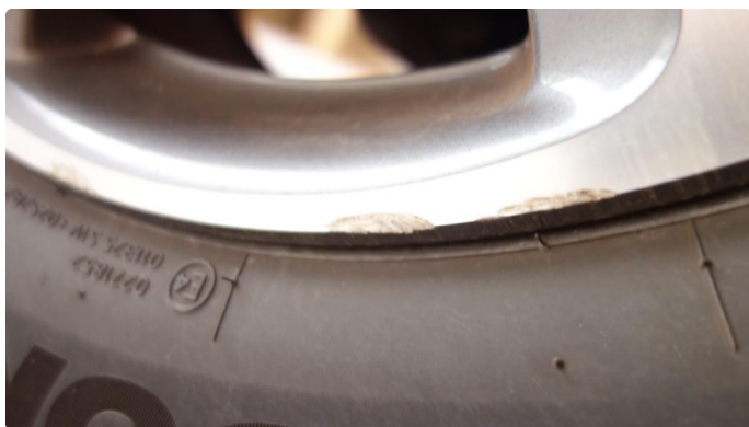
1.2 Kantkjørt felg Diamond Cut