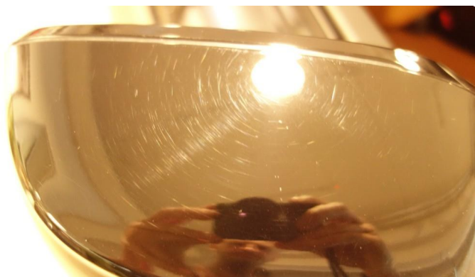
1.1 Generelt mye riper