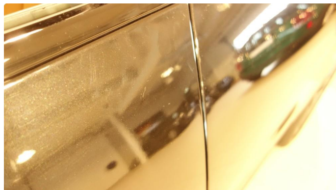
1.1 Generelt mye riper