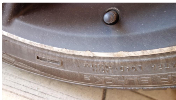
1.2 Kantkjørt felg Diamond Cut