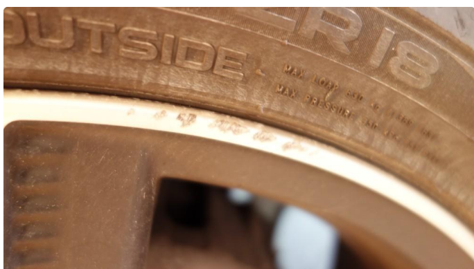
1.2 Kantkjørt felg Diamond Cut