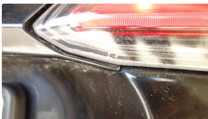
2.1 Krakelering i plast