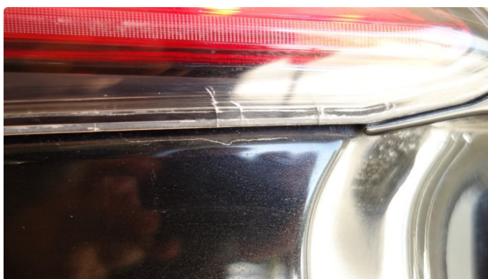
2.1 Krakelering i plast