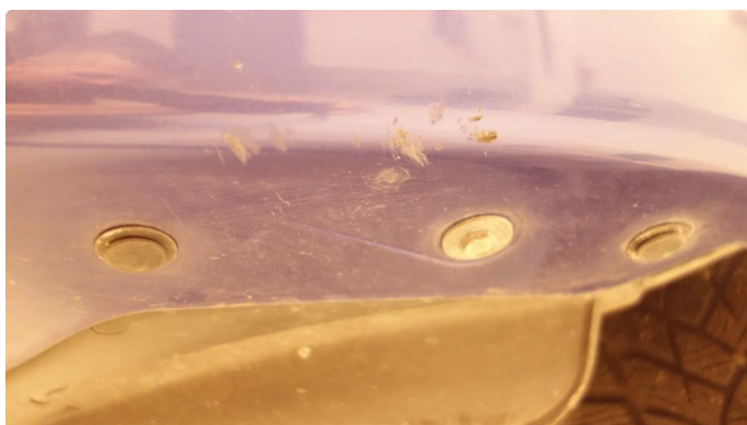
1.3 Skrubbskader underkant