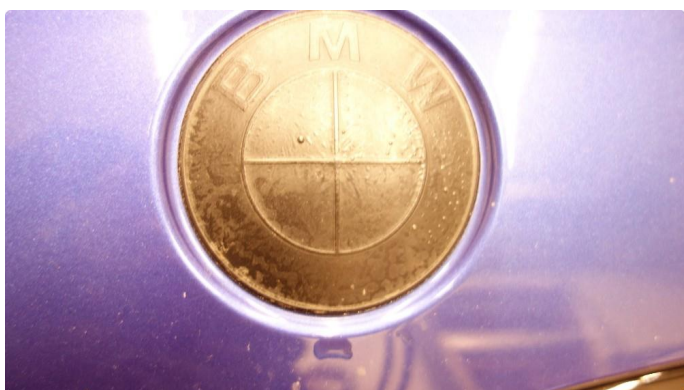
1.1 Mye stensprut