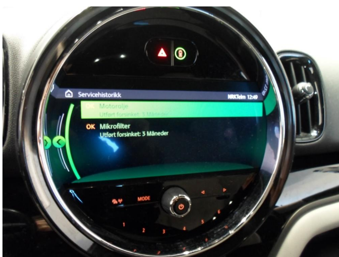
2.1 Service etter bilens intervall ikke fulgt