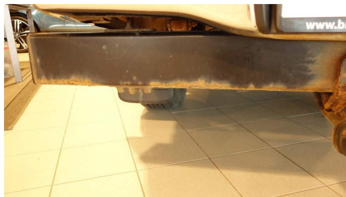
1.3 Øvrige feil