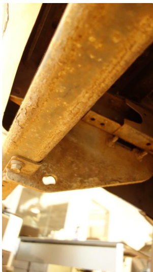
1.3 Øvrige feil