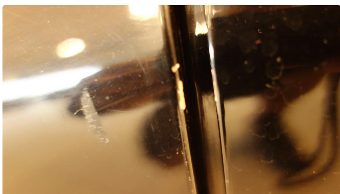
1.1 Lakk flasser