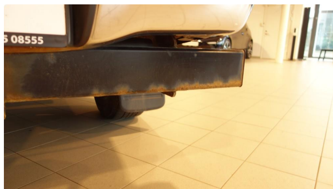
1.3 Øvrige feil