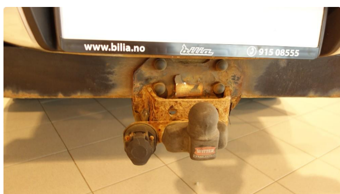
1.3 Øvrige feil