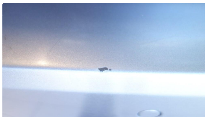
1.4 Hakk innlasting bakluke flekkes