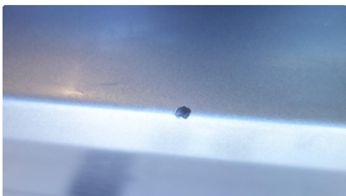
1.4 Hakk innlasting bakluke flekkes