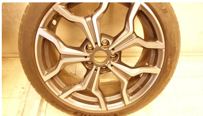
1.4 Navkopp mangler