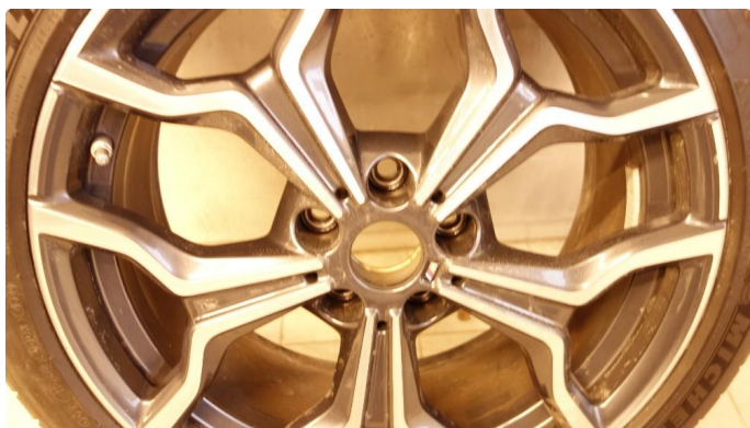
1.4 Navkopp mangler