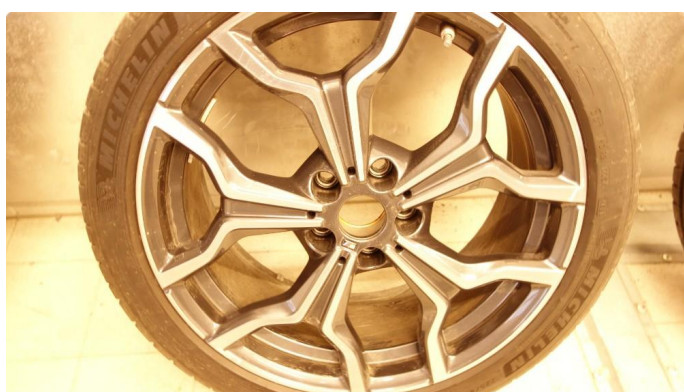
1.4 Navkopp mangler