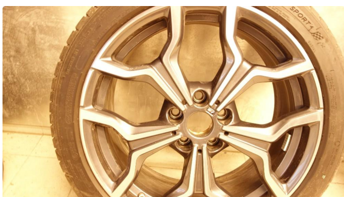
1.4 Navkopp mangler