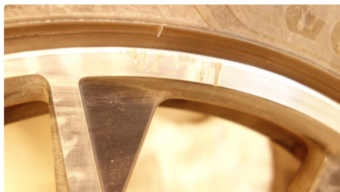
1.5 Kantkjørt felg Diamond Cut