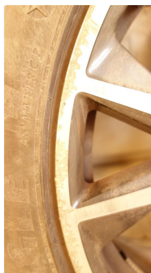
1.3 Kantkjørt felg Diamond Cut