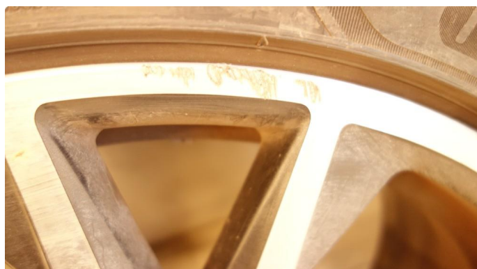
1.4 Kantkjørt felg Diamond Cut