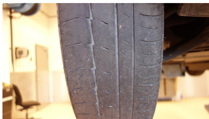
1.2 For lite mønsterdybde sommerdekk 2 stk