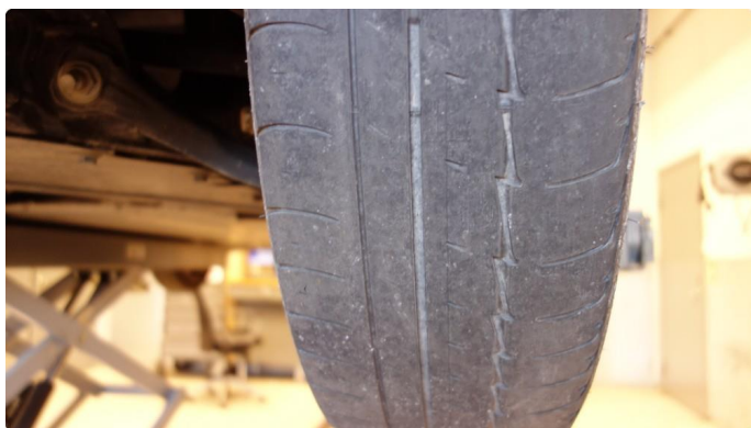
1.2 For lite mønsterdybde sommerdekk 2 stk