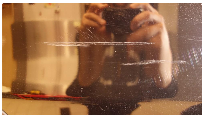
1.4 Ripe(r) ned til grunning