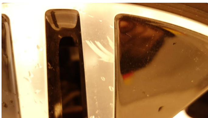
1.3 Kantkjørt felg Diamond Cut