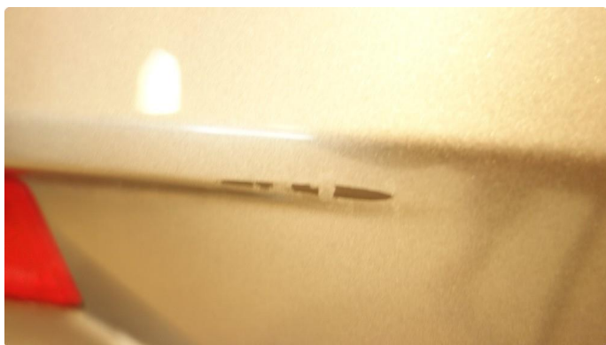
1.3 Skade - flakklakkes