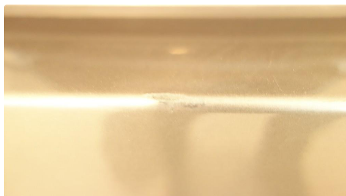
1.3 Skade - flakklakkes