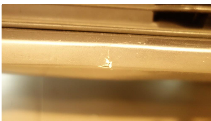
1.4 Skade - flakklakkes