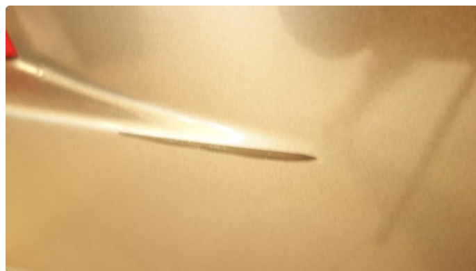
1.3 Skade - flakklakkes