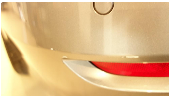
1.3 Skade - flakklakkes