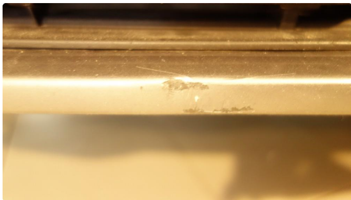
1.4 Skade - flakklakkes