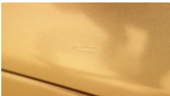
1.1 Skade - flakklakkes