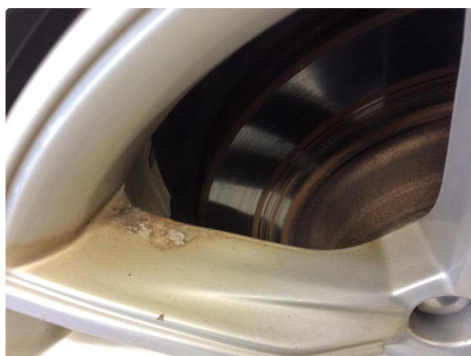
1.6 Påbegynnende oksidering