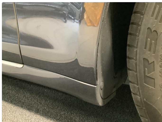
1.4 Lakk flasser - behandlet med flekklakk