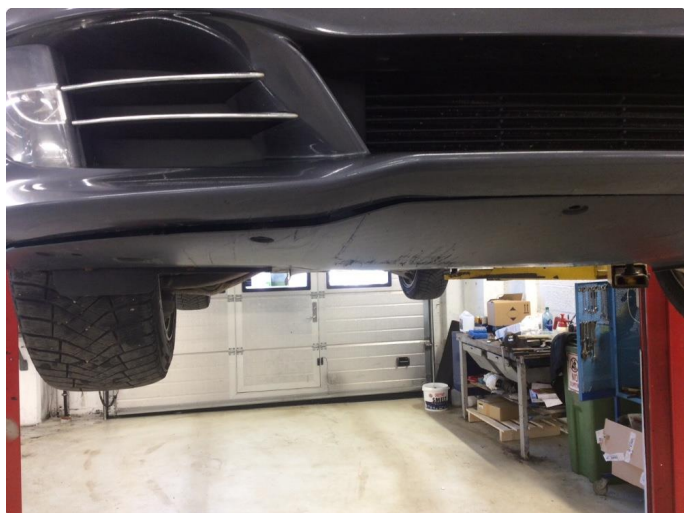
1.10 Skrubbskader underkant