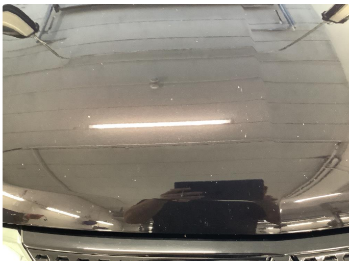
1.1 Noe steinsprut med rust - behandlet med flekkklakk