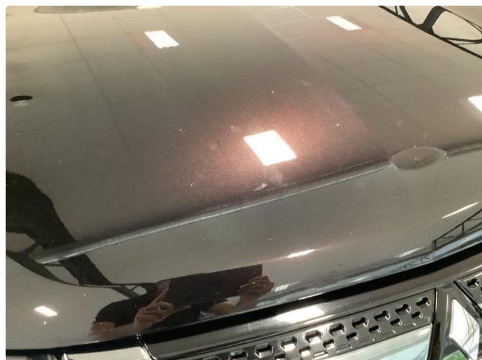
1.2 Steinsprut - behandlet med flekkklakk