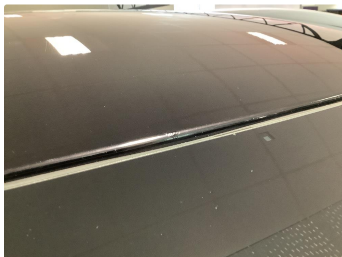
1.4 Steinsprut med rust - behandlet med flekkklakk