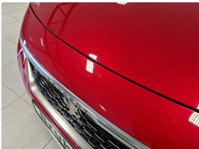
1.2 Steinsprut. En del mindre steinsprut, og noen småriper på støtfanger foran. Plastdel dermed ikke fare for rust.