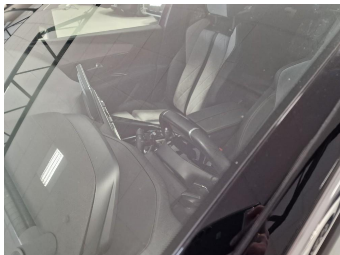
1.3 Steinsprut. Noen mindre steinsprutmerker i frontruten.