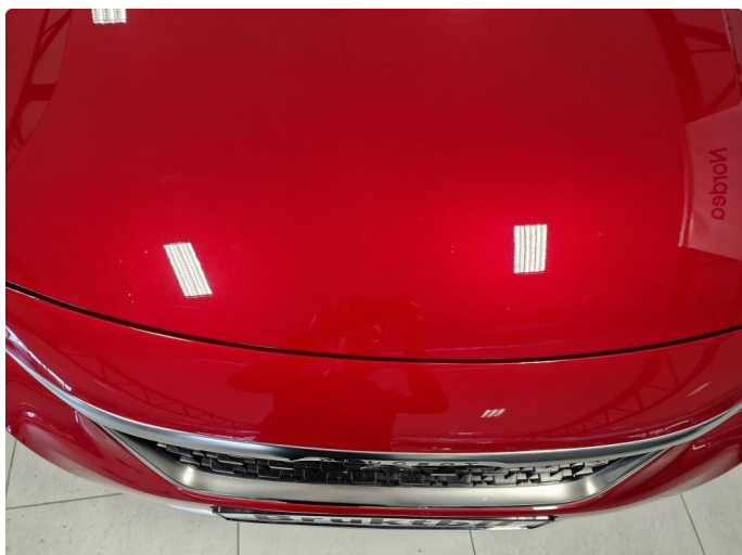
1.1 Steinsprut. En del mindre steinsprut, og noen småriper på panser. Steinsprut er behandlet med flekklakk.