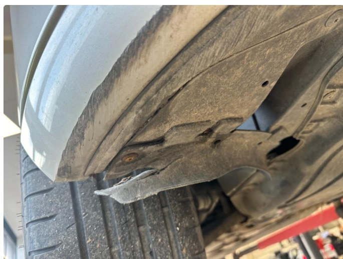
1.4 Litt oppripet på underside av fanger foran