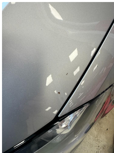
1.2 Noen steinsprut i panser