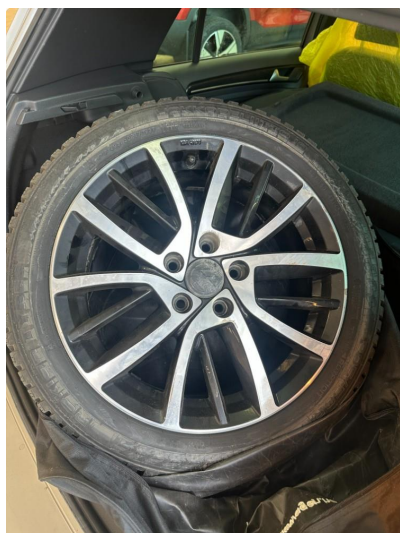
1.3 Påbegynnende oksidering på vinterfelger