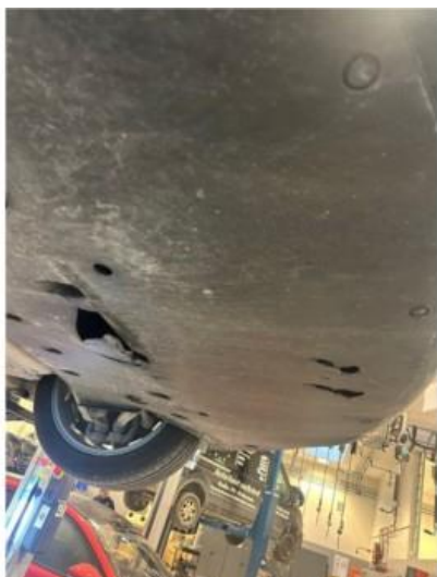
1.1 Noe hull i beskyttelsesplate under bilen