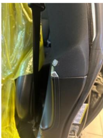
2.1 Lita rift i deksel b-pilar venstre side