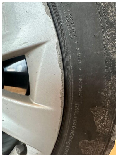
1.2 En sommerfelg litt kantkjørt