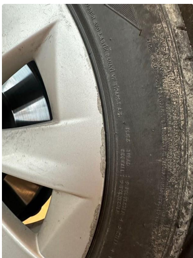
1.2 En sommerfelg litt kantkjørt